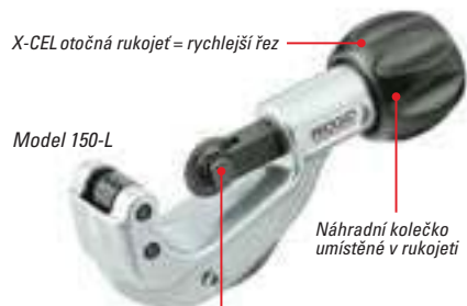
X-CEL čep = rychlejší výměna kolečka